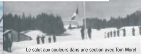
Le salut aux couleurs dans une section avec Tom Morel

Le sentier “historique” vous permettra de marcher sur les traces de ces hommes qui avaient choisi de “vivre libre ou mourir”. Accessible à pied, à raquette.